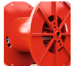
Maschinenspule mit Kernstreben