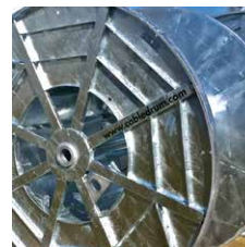
Tourets pour machines