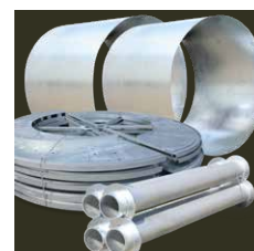
kits optimisés pour le transport

Nous fabriquons des tourets en acier avec un diamètre de joue de 630 mm à 10 000 mm et supportant jusqu'à 250 tonnes de charge utile.