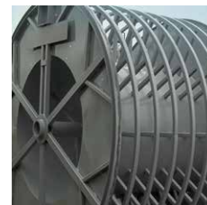
Touret export, Touret métropole